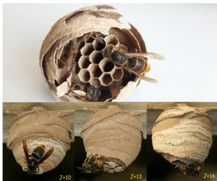
Nid primaire « naissant »