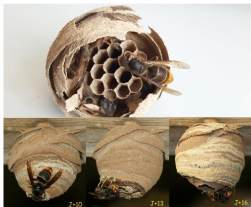
Nid primaire « naissant »

Dans une première phase , il s'agit de reconnaître cet insecte et de l'annoncer sur le site web : www.frelonasiatique.ch . Toute présence doit être annoncée et ceci peut se faire par tout le monde. Les apiculteurs sont les personnes les plus proches du frelon asiatique. Ce sont les premiers bénévoles dans cette lutte. En plus de l'identification (dépistage) de l'insecte, ils sont également invités à aller jusqu'à repérer les nids. Une équipe de la Task Force formée à la télémétrie vient ensuite localiser l'emplacement exact du nid. Dans une deuxième phase , le nid est détruit et démonté par une personne spécialisée et autorisée.